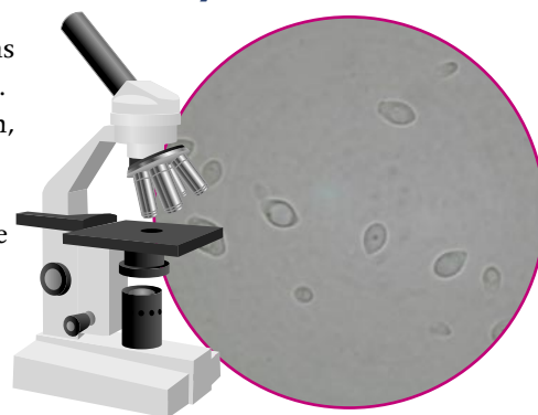
Brettanomyces vues au microscope

Ce micro-organisme est donc considéré comme une levure d'altération pouvant contaminer les moûts et les vins au cours des opérations pré et post-fermentaires.