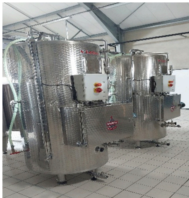
FIGURE 1 : Cuvées isobariométriques pour la prise de mousse du vin effervescent

► Exploration des attentes et freins autour d'un nouveau vin blanc effervescent en vignobles nantais Le concept d'un « vin effervescent de Nantes » suscite un intérêt notable, en particulier parce qu'il est perçu comme une opportunité de dynamiser l'offre des vins de Nantes. Le terme de « Fines bulles » est particulièrement apprécié. Cependant, les participants expriment également des attentes et des hésitations concernant les particularités du produit. Certains s'interrogent sur la différenciation sensorielle, sur la quantité de sucre et sur la précision des informations relatives aux cépages. L'affirmation d'un vin adapté à toutes occasions divise les participants. Si certains